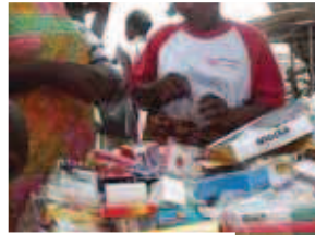
Vente de médicaments contrefaits sur le marché de Cotonou.

Cette Centrale a pour mission d'approvisionner en médicaments essentiels sous nom générique l'ensemble des formations sanitaires du secteur public et du secteur privé à but non lucratif. L'objectif de cette action est d'améliorer la disponibilité du médicament essentiel en agissant principalement sur la réduction des ruptures de stock et des péremptions, ce, pour améliorer la satisfaction du client.