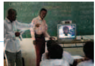
Session de sensibilisation dans un collège de Cotonou

Au-delà de ces actions, la Fondation Pierre Fabre, en 2005, met en place des sessions d'informations et de sensibilisation auprès des enfants des collèges (de la sixième à la quatrième) à partir d'un documentaire privilégiant l'interactivité entre les jeunes et un animateur professionnel présent dans la salle de classe.