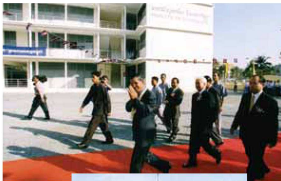
La nouvelle Faculté de Pharmacie de Phnom Penh

Soutenue par tous ceux qui voudront bien l'accompagner dans son action, je ne doute pas qu'elle saura, pour le bien de tous, relever d'importants défis en permettant aux populations de bénéficier de médicaments et de soins de qualité.