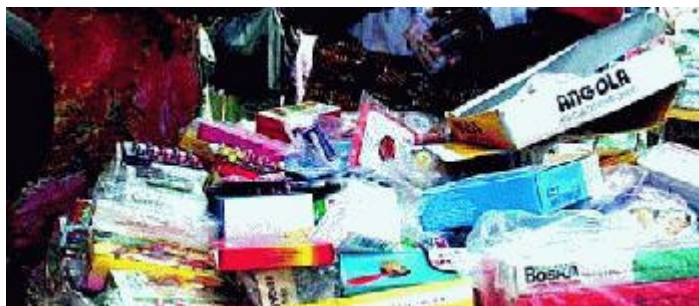
Le marché aux « médicaments » de Cotonou : souvent faux ou devenus inactifs

L'événement qui a tout déclenché remonte à une quinzaine d'années. Pierre Fabre est en voyage au Nigeria. « J'étais, raconte-t-il, avec mon ami Jean-Baptiste Doumeng (industriel de l'agroalimentaire aujourd'hui disparu, célèbre sous le surnom de « milliardaire rouge », en raison de ses liens avec le Parti communiste, NDLR). A Lagos, la capitale, nous avons vu des enfants que l'on vaccinait sur un marché contre une épidémie avec des faux vaccins. Au lieu du principe actif, on avait mis de l'eau distillée ! Et comme nous avons été repérés par la mafia qui menait l'opération, nous n'avons dû notre salut qu'à la fuite, sous la protection des gardes du corps de Doumeng ! »