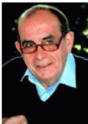
Pierre Fabre : une fondation pour la santé dans les pays émergents

Une faculté de pharmacie toute neuve à Phnom Penh (Cambodge) avec un cursus pédagogique revu de A à Z ; un laboratoire national du médicament réhabilité à Cotonou (Bénin) et une centrale d'achat des médicaments essentiels remise sur pied ; un programme de recherche sur la trypanosomiase qui ravage l'Afrique noire intertropicale : les premières actions de la jeune fondation Pierre Fabre ont été lancées dans la plus totale confidentialité. La guerre contre le faux médicament et pour l'accès aux médicaments essentiels ne se paie pas de mots.